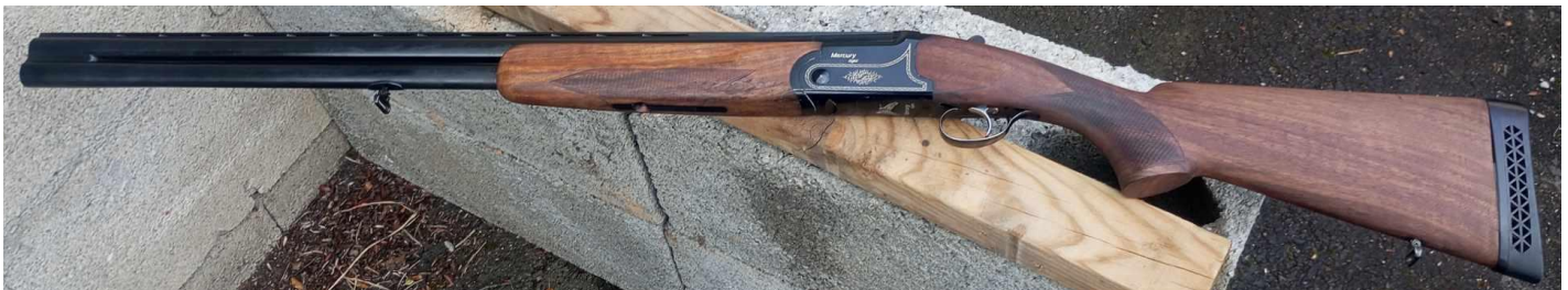
Fusil Mercury Light, calibre 12g, Cat C

Contact: mettierad@gmail.com , 06 09 90 67 74