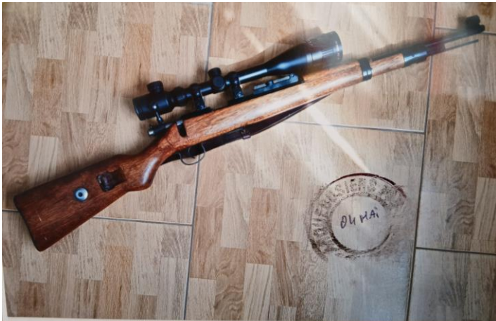
Carabine Norengo Modèle JW 254 Matricule 0852066 22 long rifle chargée + Lunette HAWKE 6,5-20-50 550€ CAT C