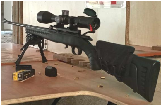
Carabine Ruger American Rimfire, calibre .22lr, canon 56cm. 1 chargeur rotatif 10 coups, Lunette Vector Optic 6-24x50 Marksman FFP sur rail penté MDT 20MOA + bonnettes, Butler Creek + niveau à bulle, Bipied Rokstad, appui joue Blackhawk Cat C : Prix 770€ !

Contact: mettierad@gmail.com , 06 09 90 67 74